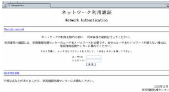
図 2 認証画面

利用方法は簡単です。PC を起動し、有線または無線でネットワークに接続すると DHCP からネットワークアドレスが自動で割り当てられます 2 。次に普段お使いの Web ブラウザを起動して適当な URL へアクセスします 3 。図 1 のような