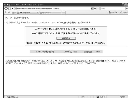
図 4 認証後の表示

用される多くの Web ブラウザで、導入した SSL サーバ証明書の正常な動作が確認できた。