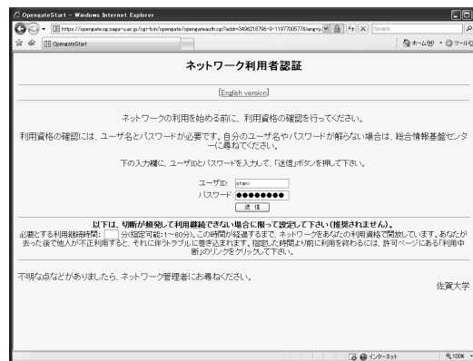
図 3 認証インタフェース

IPv6 対応の Opengate は、利用者端末の IP アドレスの取得方法が、従来のものと異なるものの、インタフェースやその利用方法は、従来の Opengate と同じになるよう開発している。このため、移行に伴う新たな利用指導も特に必要としなかった。また、Opengate 環境下で利